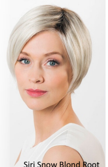
Siri Snow Blond Root

Wij houden zo-wie-zo van verschillende kleuren in het haar.