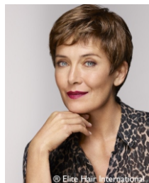
Model Elegance kleur 209

Wij zijn altijd op zoek naar mooie nieuwe modellen. Vanaf nu hebben wij Elite Hair in onze collectie.