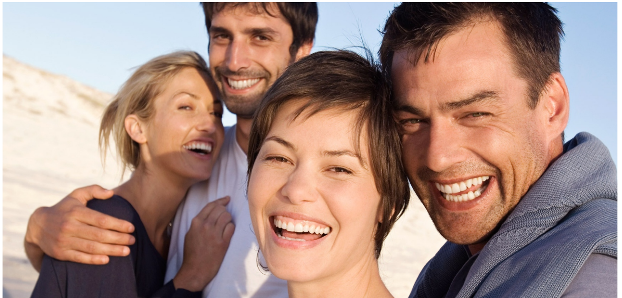
Afbeelding Dening Haircompany