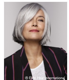
Model Alure kleur 44/60

Herkent u dit en wilt u meer weten ga dan naar onze website capellehaarwerken.nl