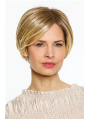
Belle Madam Model Cosma mono Hi kleur Honey mix root